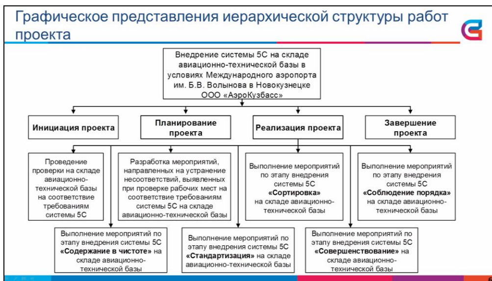
Рисунок Ж.2.3 – Пример оформления рисунка в презентации