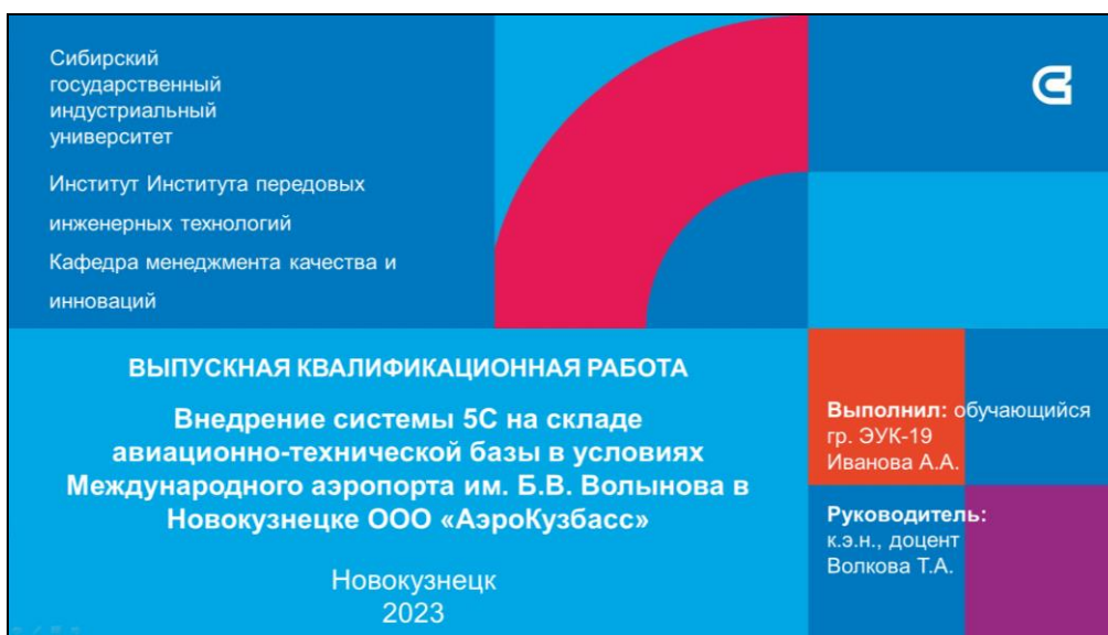
Рисунок Ж.2.1 – Пример оформления титульного листа презентации